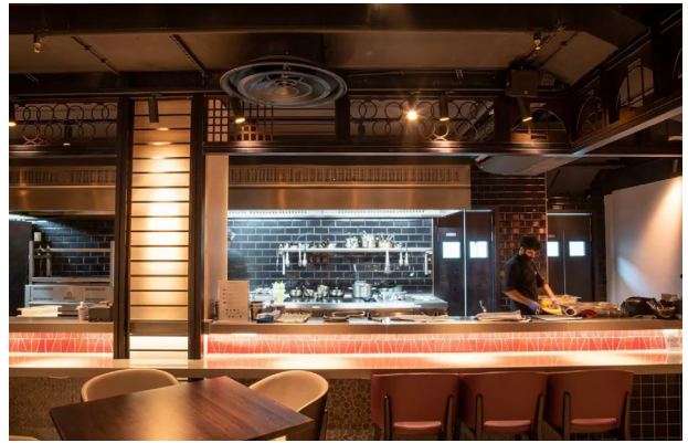
AKI には合計 12 台の L-Acoustics 5XT が導入されました

LOA の新しいシステムは 34 台の 5XT 同軸エンクロージャー、と 10 台の SB15m サブウパーで構成されており、レストランとラウンジの室内と屋外の両方を完璧にカバーしています。AKI のシステムは 6 台の X4i と 12 台の 5XT 同軸エンクロージャー、6 台の X8 同軸ポイントソース・スピーカー、4 台の SB15 m サブウパーで構成されており、レストラン、バー、ラウンジとプライベートダイニングルームをカバーしています。2 か所とも 6 台の LA4X と 4 台の LA2Xi アンプリファイド・コントローラーを使用しておりますが、LOA はさらに 1 台の LA12X でシステムライブを強化しています。