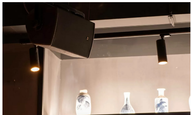
AKI に合計 6 台の X8 が導入されました