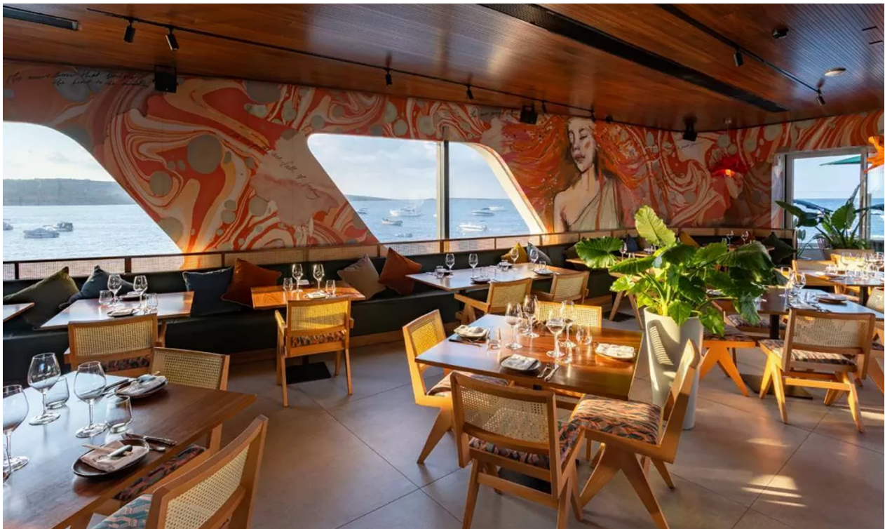
LOAには合計34台の5XTが導入されました