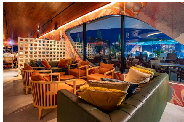
LOAはL-Acousticsシステムで洗練された雰囲気を補完しました